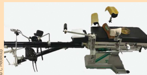
Figure 3. Table préparée pour un décubitus latéral.