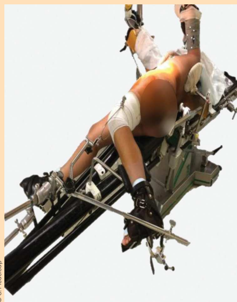
Figure 4. Une fois l'anesthésie en place, les pieds du patients sont placés dans des pansements de type "américains" pour les protéger, puis chaussés de bottillons.

■ Une contre-extension permettra une traction efficace. C'est le rôle de l'appui périnéal qui devra être efficacement protégé et rembourré afin de limiter les risques liés à l'installation. Il permet également de maintenir le patient sur la table lors des différents mouvements.