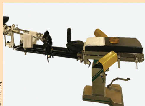
Figure 1. Table préparée pour un décubitus dorsal.