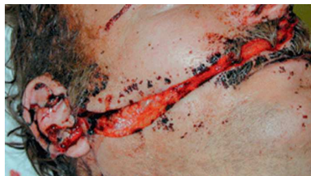
Fig. 6.5. Plaie de la face avec section des branches du nerf facial.

Les plaies de la région parotidienne peuvent léser le tronc ou les branches du nerf facial (figure 6.5). La constatation d'une paralysie faciale impose une réparation chirurgicale immédiate.