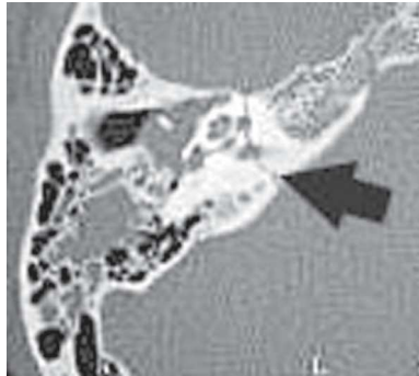
Fig. 6.4. Fracture du rocher droit avec un trait (flèche) traversant le conduit auditif interne, responsable d'une paralysie faciale et d'une cophose.